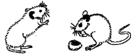
Rötelmaus oder Gelbhalsmaus

Die Nuss wurde senkrecht zum Lochrand benagt.